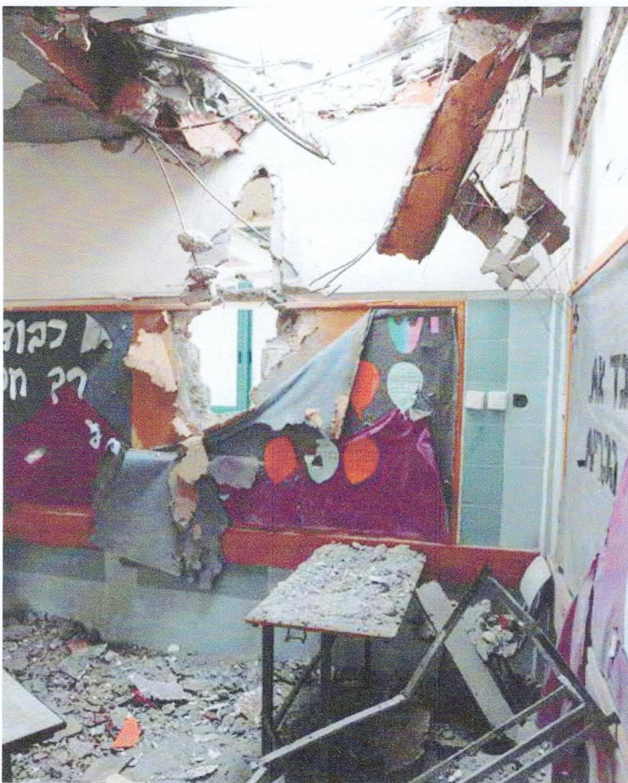
"עופרת יצוקה" תוצאות פגיעת טיל גראד בכיתת בית ספר בבאר שבע.